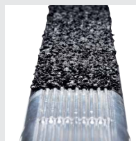
SprossenSafe R 13