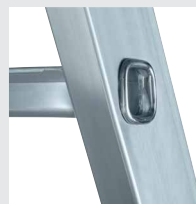
4-fach gebördelte Sprossen- / Holmverbindung