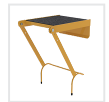
Einhängepodest R 13 Bestell-Nr. 19900