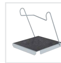
Einhängetritt R 13 Bestell-Nr. 19910