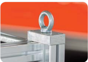
Abb. Bestell-Nr. 120040