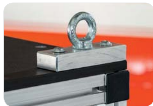
Abb. Bestell-Nr. 120041