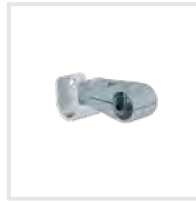
Einhängehaken Bestell-Nr. 70750