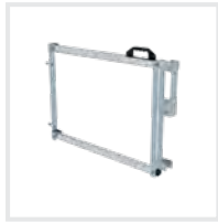
Sicherungsschranke Bestell-Nr. 690746 – 690748