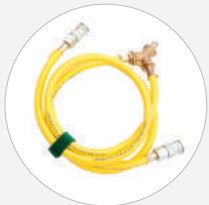
BEFÜLLUNGSVERTEILER 1 M, GELB S522999