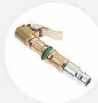
LKW-REIFENVENTIL- ANSCHLUSS S519806