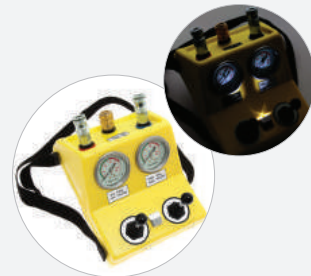
DOPPELSTEUERORGAN MIT TOTMANN SCHALTUNG 8 BAR – LED LEUCHTEN, KUNSTSTOFFGEHÄUSE S576803