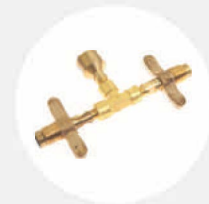
DOPPELANSCHLUSS FÜR DRUCKLUFT- FLASCHE S529383