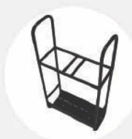
SICHERHEITSSTÄNDER – ZWEI DRUCKLUFT- FLASCHE, 6 L MODUL WAGENSYSYSTEM S542868