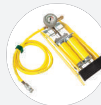
FUß PUMPE 8 BAR S538320