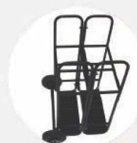
SICHERHEITSSTÄNDER – VIER DRUCKLUFT- FLASCHE 6 L MODUL WAGENSYSYSTEM S542872