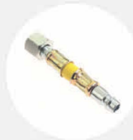
LKW-REIFENVENTIL- ADAPTER S519807