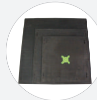
LASTPLATTEN LASTPLATTE # 350 S556308 LASTPLATTE # 420 S556309 LASTPLATTE # 520 S556310 LASTPLATTE # 670 S556311