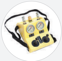
DOPPELSTEUERORGAN MIT TOTMANN SCHALTUNG 8 BAR – KUNSTSTOFFGEHÄUSE S528126