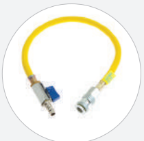
SCHLAUCH MIT ABSPERRVENTIL 0,5 M S525278