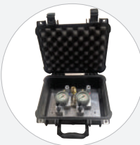
DOPPELSTEUERORGAN 8 BAR - KOFFER S579558