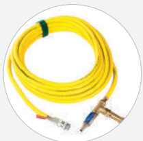
SCHLAUCH MIT ABSPERR- UND SICHERHEITSVENTIL 8 BAR, 10 M S544111