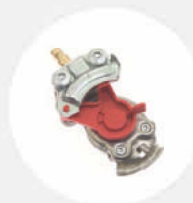
LKW-DRUCKLUFT- ANSCHLUSS S529005