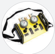
DOPPELSTEUERORGAN MIT TOTMANN SCHALTUNG 8 BAR – METALLGEHÄUSE S528132