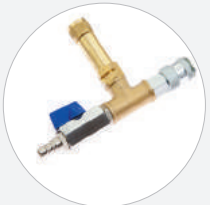
ABSPERR- UND SICHERHEITSVENTIL 8 BAR S519051