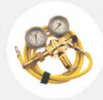
DRUCKMINDERER 200/300 BAR S523835