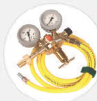
DRUCKMINDERER 300 BAR S557311