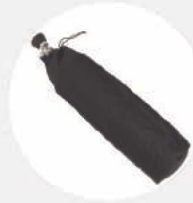
TRANSPORTSACK FÜR DRUCKLUFTFLASCHE S519811