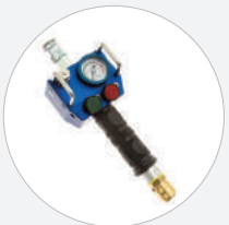
EINZELSTEUERORGAN MIT TOTMANN SCHALTUNG 8 BAR, HANDGEHALTEN S519819