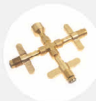
DREIFACHER ANSCHLUSS FÜR DRUCKLUFTFLASCHE S529384