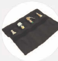
UNIVERSALER VERBINDUNGSSATZ S519809