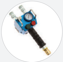
DOPPELSTEUERORGAN MIT TOTMANN SCHALTUNG 8 BAR, HANDGEHALTEN S519820