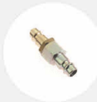
DRUCKLUFT- ANSCHLUSS S519808