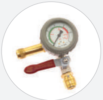
EINZELSTEUERORGAN 8 BAR, FITTING- BAUWEISE S76681