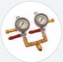
DOPPELSTEUERORGAN 8 BAR, FITTING- BAUWEISE S76682