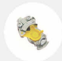
LKW-DRUCKLUFT- ANSCHLUSS – BLINDKUPPLUNG S529006