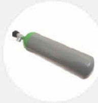
DRUCKLUFTFLASCHE 300 bar, 6l S528746

Das Zubehör für das Befüllen sichert eine präzise Steuerung, eine hohe Zuverlässigkeit und eine lange Lebensdauer. Die Zubehörteile können mit allen Hebekissen von Savatech verwendet werden, und zwar von der Luftquelle bis zu den Steuerorganen.