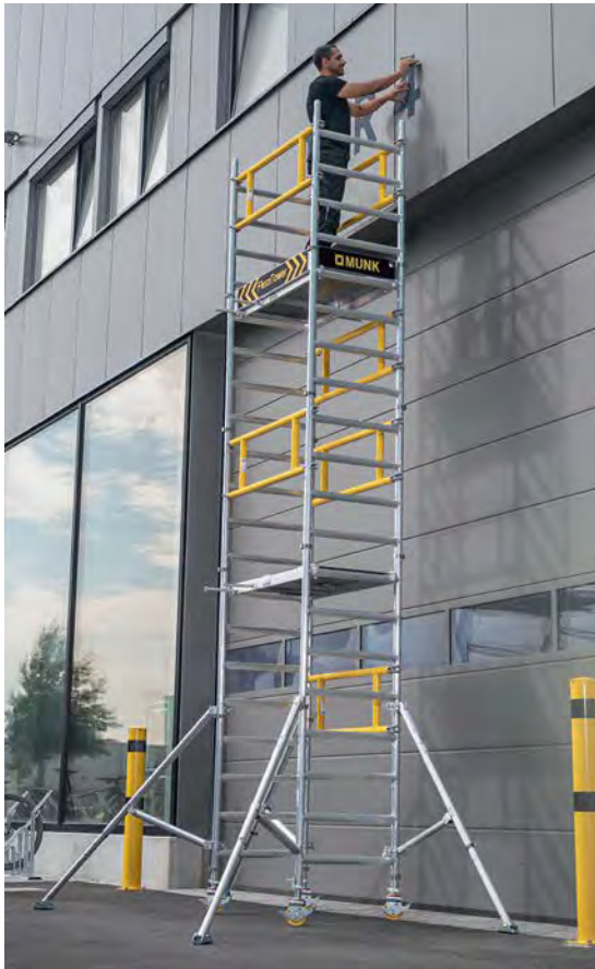
Abb. Bestell-Nr. 125100