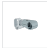
Einhängehaken Bestell-Nr. 70750