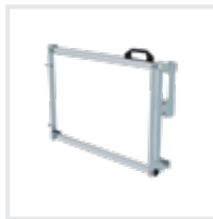
Sicherungsschranke Bestell-Nr. 70746 – 70748