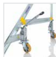
Fahrwerke Konfigurierbar / auf Anfrage