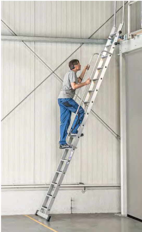
Abb. Bestell-Nr. 40356