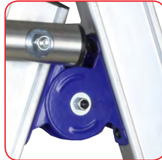
Grosse Scharniere aus lackiertem Stahl