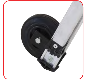
Räder Ø 150 mm