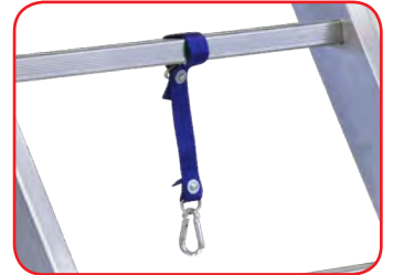
Sicherungsgurt für den Transport