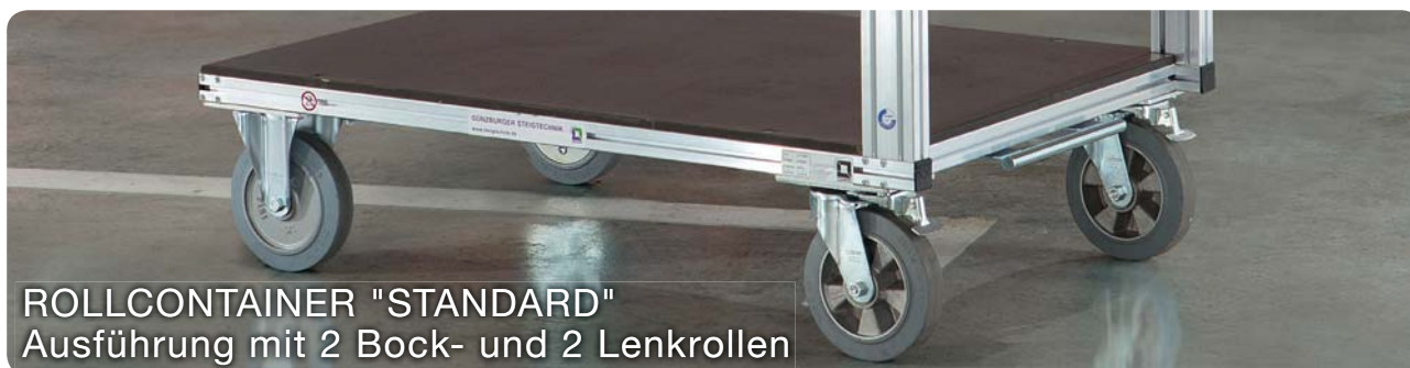
ROLLCONTAINER "STANDARD" Ausführung mit 2 Bock- und 2 Lenkrollen