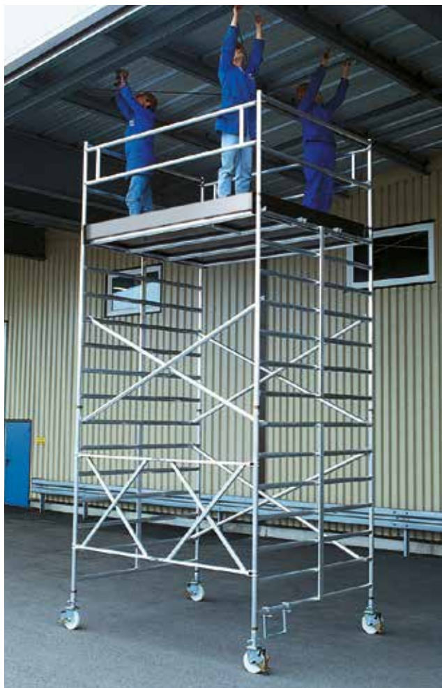
Abb. Bestell-Nr. 115543