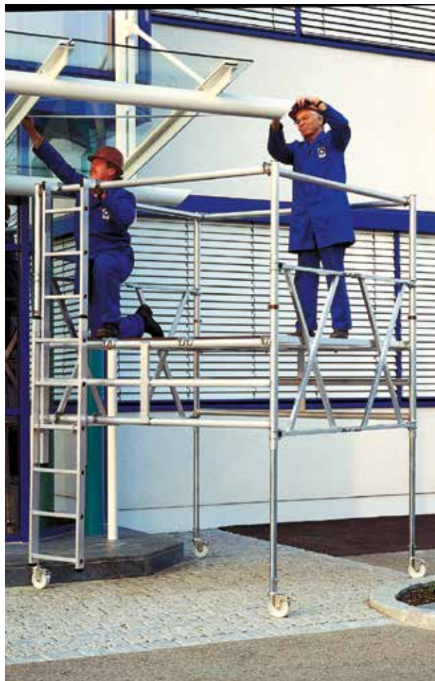
Abb. Bestell-Nr. 115800 mit Leiter Bestell-Nr. 27142