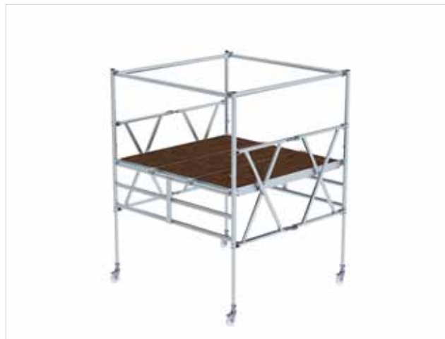
Abb. Bestell-Nr. 115800