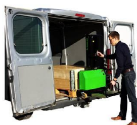
Die Gabeln finden ihren Platz unter der Last