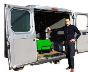
Fertig in nur 30 Sekunden