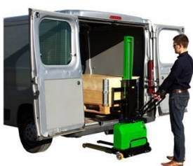
Verladung der Ware in das Fahrzeug

Der Innolift trägt, bewegt, lädt und entlädt Lasten oder Paletten bis zu 600 kg. Er ist leicht und lädt sich selbstständig in Kleintransporter auf und ab. Probleme beim Entladen einer schweren Last sind mit dem Innolift schnell gelöst.