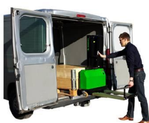
Auf Knopfdruck verlädt der Innolift sich selber