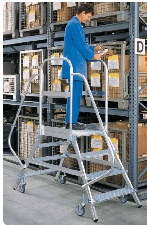
Abb. Best.-Nr. 51204 mit Handlauf Best-Nr. 50209 und Rollen