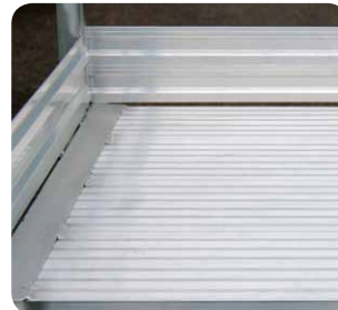
Große Plattform, 800 mm lang, 600 mm breit.