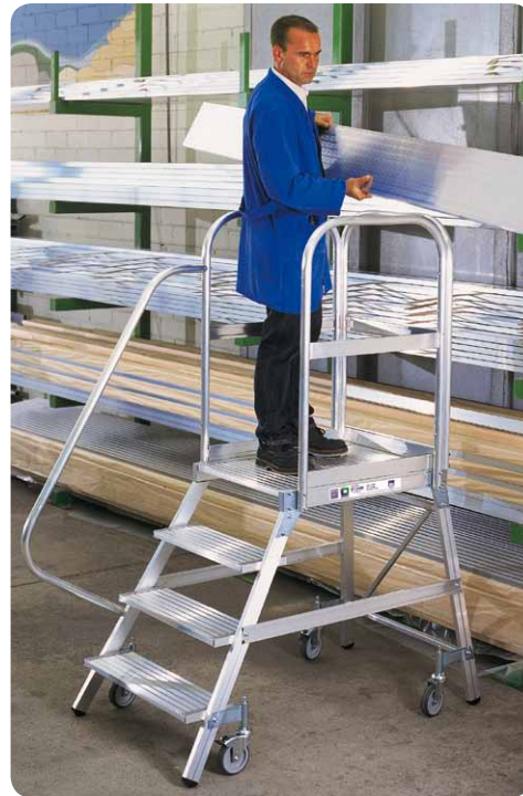
Abb. Best.-Nr. 50104 mit Handlauf Best.-Nr. 50109 und Rollen