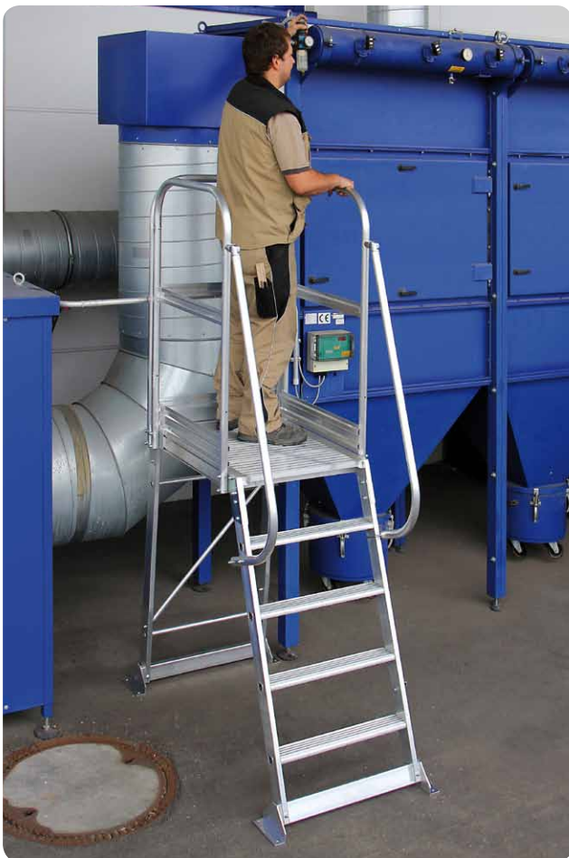
Abb. Best.-Nr. 303305

Versand erfolgt in Baugruppen zum einfachen Zusammenbau; Anleitung liegt bei.