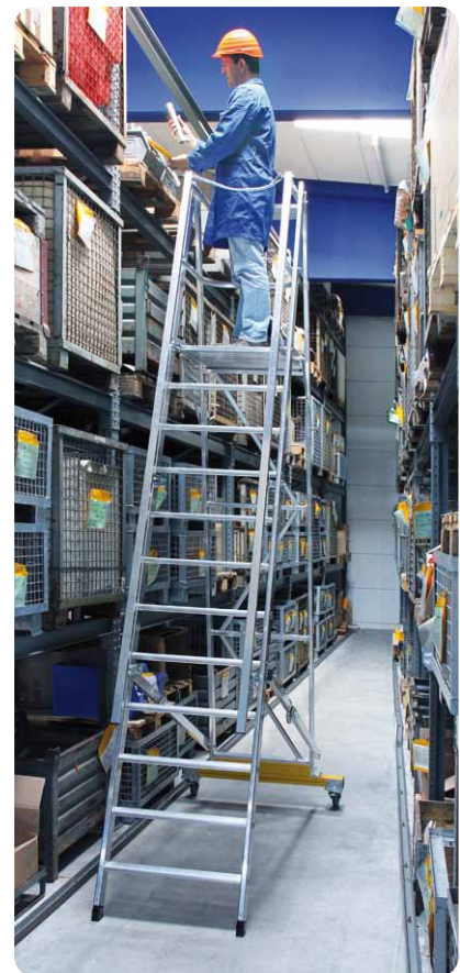
Abb. Best.-Nr. 52312 mit schmaler Quertraverse und Ballastgewicht.