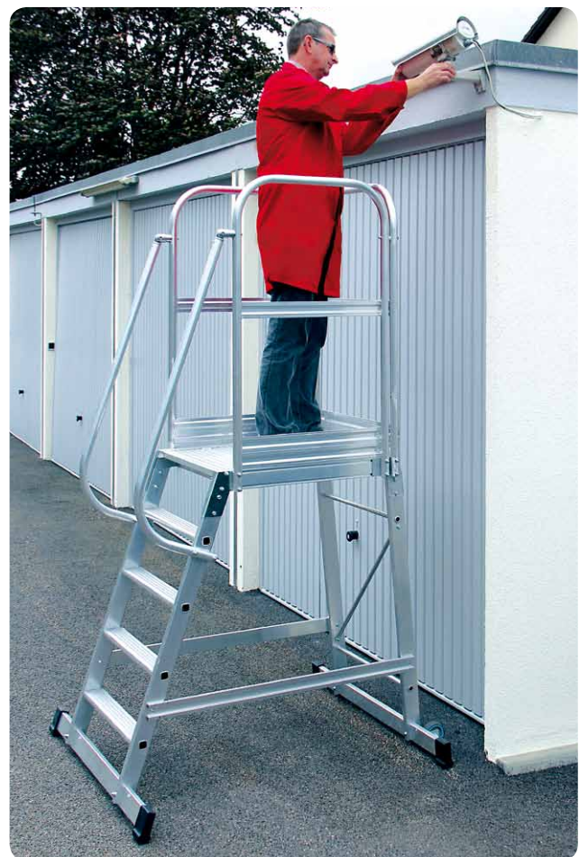
Abb. Best.-Nr. 303105

*4-stufige Ausführung mit einer Quertraverse.