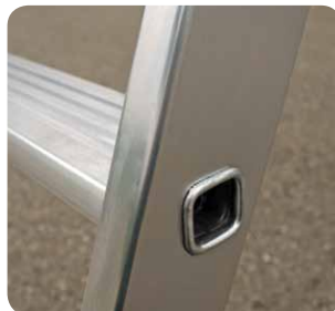
Gebördelte Stufen, 80 mm tief.