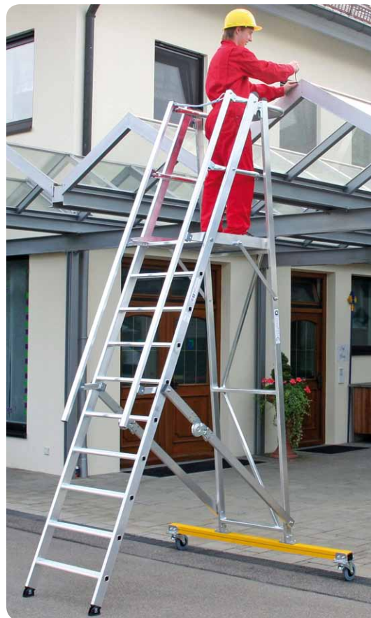
Abb. Best.-Nr. 52310