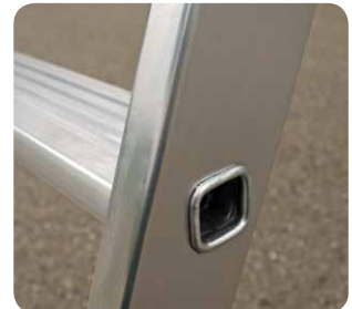
Gebördelte Stufen, 80 mm tief.