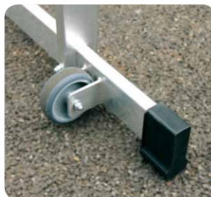
Quertraverse mit Rollen