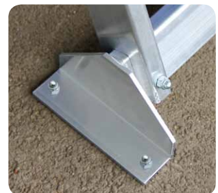
Fußwinkel zur Bodenbefestigung.