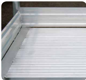
Große Plattform, 800 mm lang, 600 mm breit.

Versand erfolgt in Baugruppen zum einfachen Zusammenbau; Anleitung liegt bei.