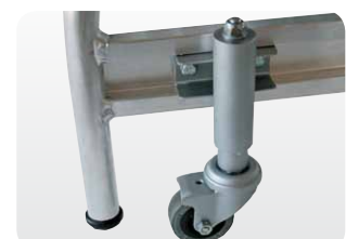
Abb. Best.-Nr. 50068/50069