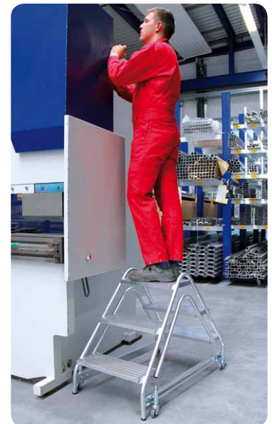
Abb. Best.-Nr. 50060 mit 4 St. Feder-Bremsrollen, Best.-Nr. 50069