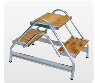
Abb. Best.-Nr. 50065