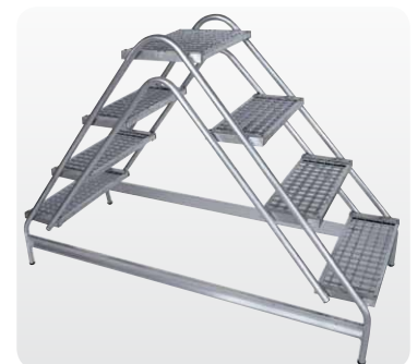
Abb. Best.-Nr. 50064