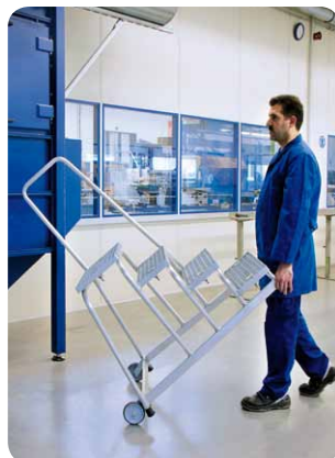
Abb. Best.-Nr. 51024