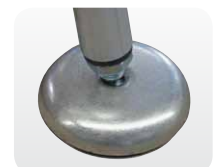
Abb. Best.-Nr. 50042