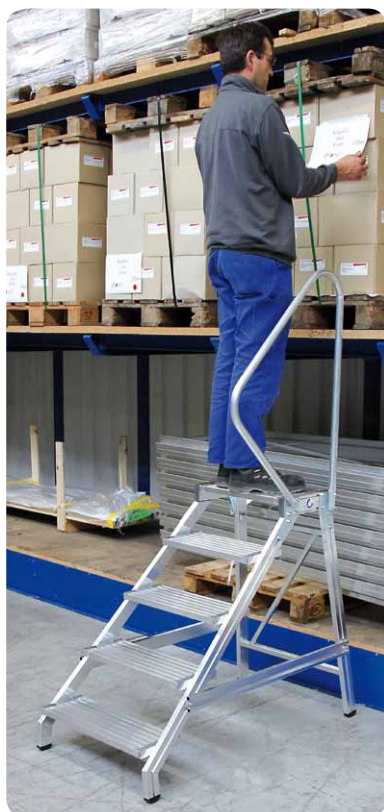
Abb. Best.-Nr. 50181