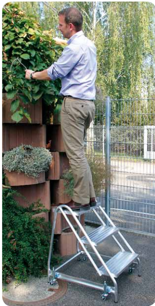
Abb. Best.-Nr. 50051 mit 4 St. Feder-Bremsrollen Best.-Nr. 50069