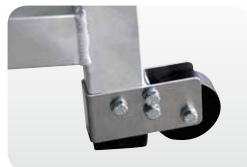
Abb. Best.-Nr. 50408