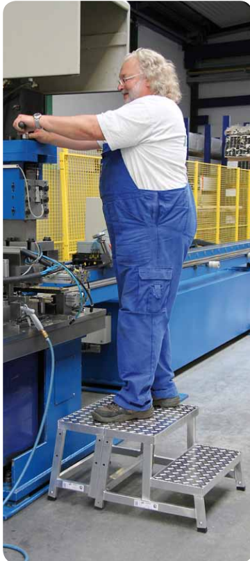
Abb. Best.-Nr. 50400 mit Best.-Nr. 50401