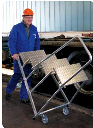
Abb. Best.-Nr. 50044 mit 50041