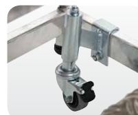
Abb. Best.-Nr. 50036