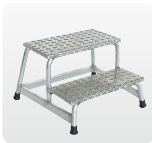
Abb. Best.-Nr. 50008