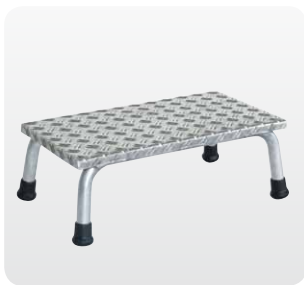
Abb. Best.-Nr. 50031

Stabile, verschweißte Rohrkonstruktion, Stufen aus Aluminium-Warzenblech, Holmenden mit rutschfesten Kunststoffschuhen. Obere Standfläche: 550 x 300 mm.