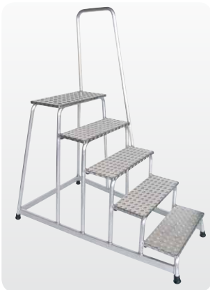
Abb. Best.-Nr. 50045