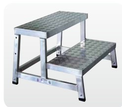
Grundmodul Best.-Nr. 50400