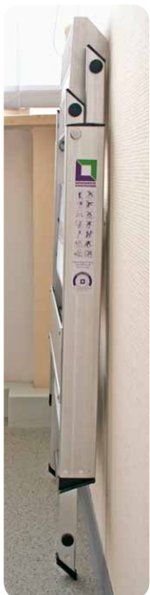
Abb. Best.-Nr. 55003