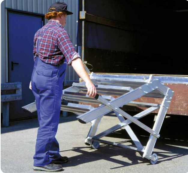
Abb. Best.-Nr. 50021