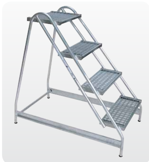
Abb. Best.-Nr. 50055