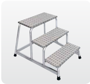
Abb. Best.-Nr. 50009