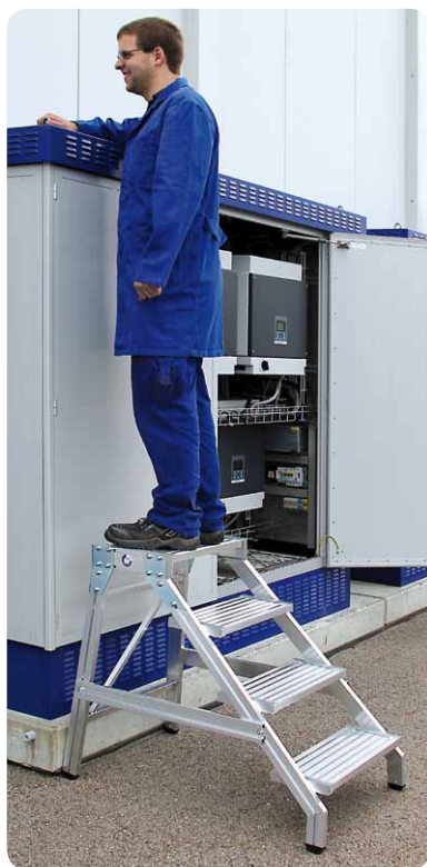
Abb. Best.-Nr. 50174