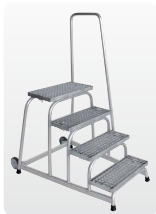
Abb. Best.-Nr. 51024