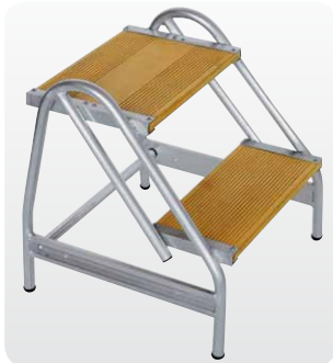
Abb. Best.-Nr. 50056