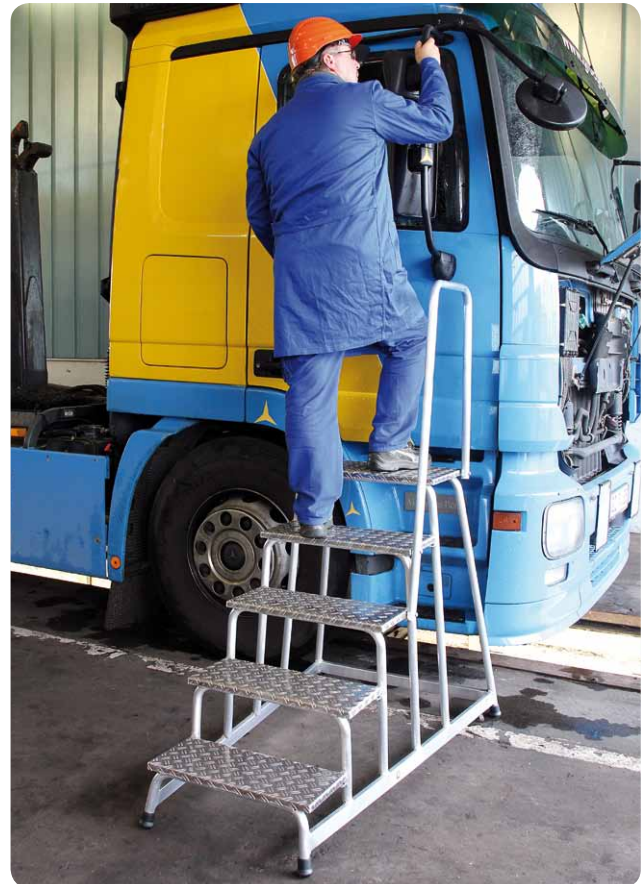
Abb. Best.-Nr. 50045