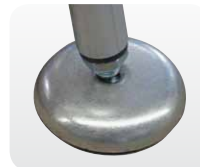
Abb. Best.-Nr. 50042