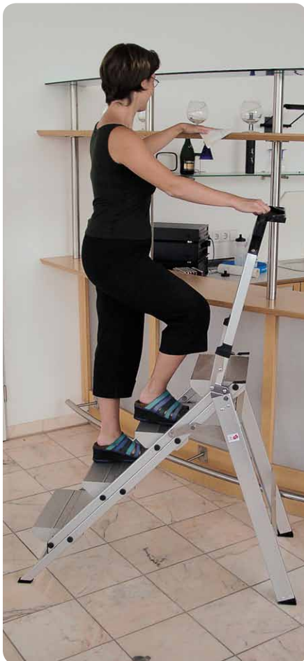
Abb. Best.-Nr. 53104