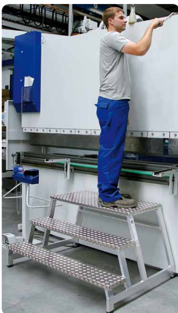
Abb. Best.-Nr. 50093