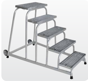
Abb. Best.-Nr. 51021