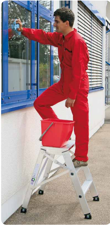
Abb. Best.-Nr. 50006