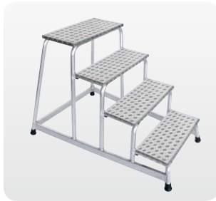
Abb. Best.-Nr. 50010