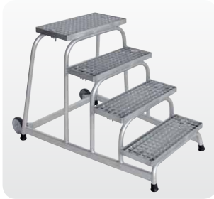
Abb. Best.-Nr. 51020