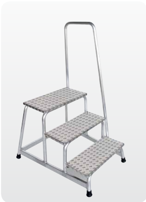
Abb. Best.-Nr. 50043

Stabile, verschweißte Rohrkonstruktion, Stufen aus Aluminium-Warzenblech, Holmenden mit rutschfesten Kunststoffschuhen. Hohe Sicherheit durch 900 mm hohen einseitigen Handlauf. Der Handlauf ist einfach anschraubbar und liegt lose bei. Obere Standfläche: 550 x 300 mm.