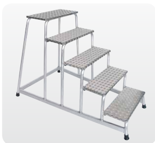
Abb. Best.-Nr. 50035