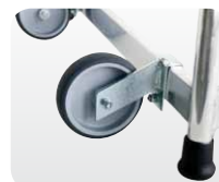
Abb. Best.-Nr. 50041