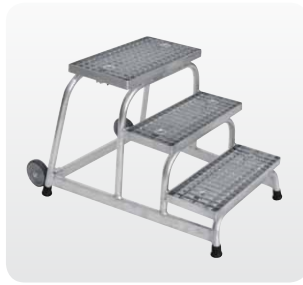
Abb. Best.-Nr. 51019