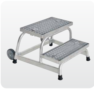
Abb. Best.-Nr. 51018