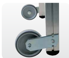
Abb. Best.-Nr. 50077