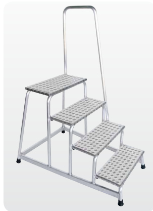
Abb. Best.-Nr. 50044