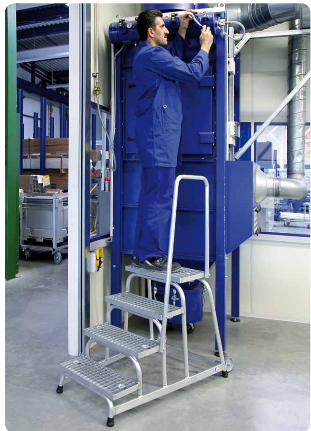
Abb. Best.-Nr. 51024