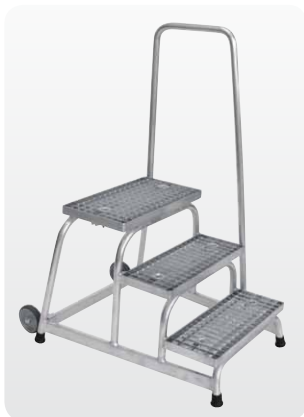
Abb. Best.-Nr. 51023