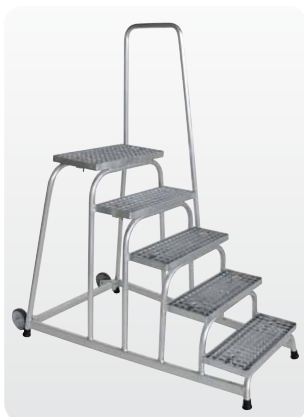
Abb. Best.-Nr. 51025