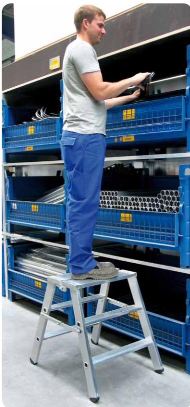
Abb. Best.-Nr. 50095