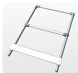
Abb. Best.-Nr. 50028