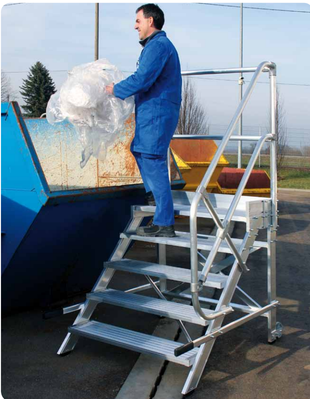
Abb. Best.-Nr. 50022 mit 50026 und 50029