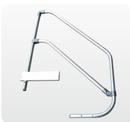
Abb. Best.-Nr. 50025