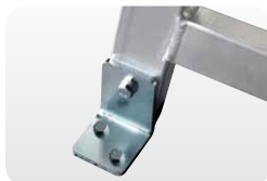
Abb. Best.-Nr. 50409