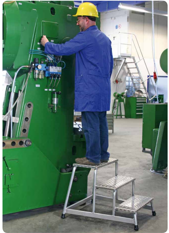
Abb. Best.-Nr. 50009