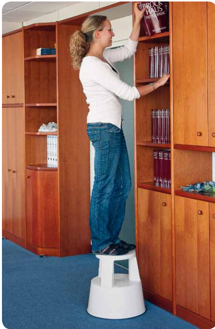
Abb. Best.-Nr. 50001