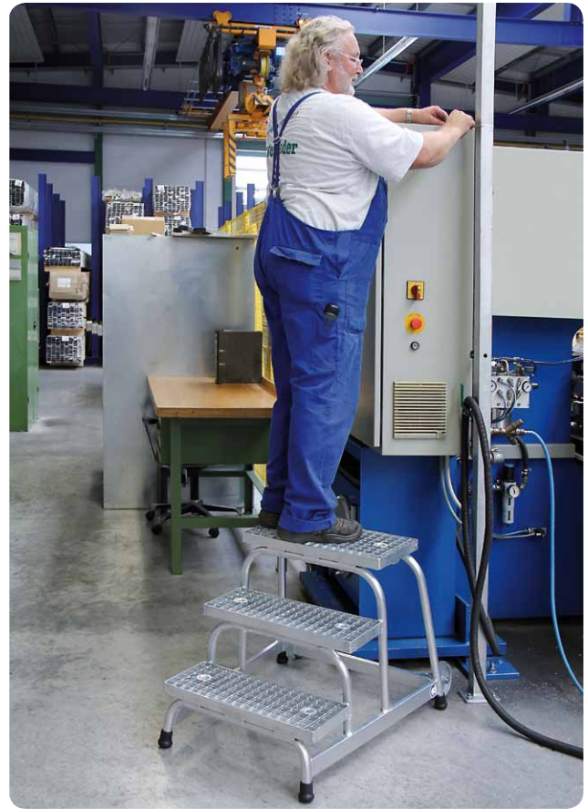
Abb. Best.-Nr. 51019