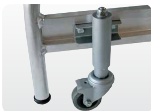
Abb. Best.-Nr. 50068/50069